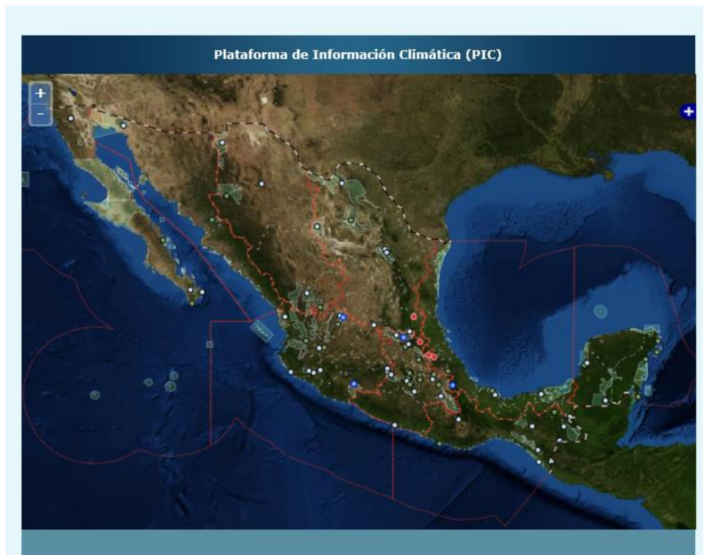
Figura 1. Mapa de la Plataforma de Información Climática (PIC) con la ubicación de 58 EMA en ANP.